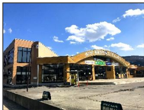
道の駅津軽白神を 出発!