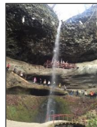
乳穂ヶ滝 (自由散策20分)