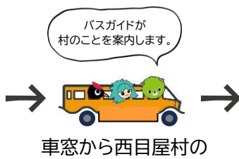
車窓から西目屋村の 景色を堪能!