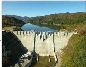
津軽ダム (自由散策20分)